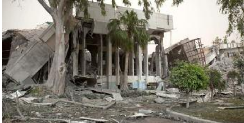
Κτήρια που επλήχθησαν από το NATO στην Τρίπολη (25/4/2011)

Ισχυρό πλήγμα δέχθηκε χθες τα ξημερώματα το κυβερνητικό τετράγωνο στην πρωτεύουσα της Λιβύης. Μαχητικά αεροσκάφη του NATO κατέστρεψαν ένα από τα κτήρια που χρησιμοποιεί ως στρατηγείο ο Καντάφι.