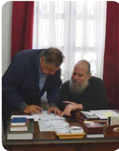
Μητρόπολη Ίμβρου 2021

χού Ίμβριοι εκφράζουμε με τον πιο αληθινό τρόπο την Αγάπη μας προς το σεπτό Πρόσωπό Σας. Αιωνία η μνήμη των γονέων σας.